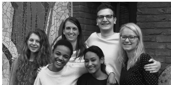
Links: bestuur december 2018, rechts: bestuur maart 2018